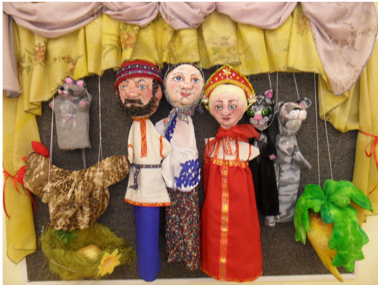
Перчаточные куклы к русским народным сказкам (ролевая игра)